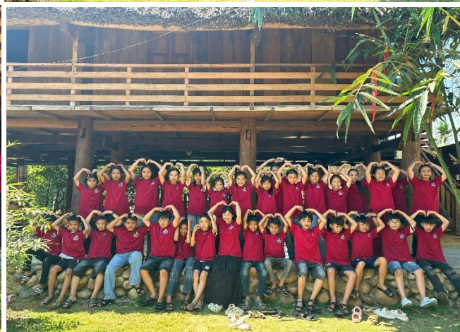
Hình ảnh học sinh chụp ảnh lưu niệm cuối chương trình

Chương trình trải nghiệm khép lại trong không khí vui tươi, rộn ràng với nhiều hoạt động tập thể và trò chơi hấp dẫn, thu hút sự tham gia nhiệt tình của tất cả học sinh. Những tiếng cười giòn tan, những khoảnh khắc gắn kết hồn nhiên đã góp phần làm nên một hành trình đầy ý nghĩa và đáng nhớ. Không chỉ là chuyến đi giúp các em mở rộng hiểu biết, chương trình còn để lại trong lòng mỗi học sinh những cảm xúc đẹp về tình bạn, tình thầy trò và niềm vui được học tập qua trải nghiệm thực tế. Đây sẽ là những kỷ niệm trong sáng, góp phần nuôi dưỡng tâm hồn, bồi đắp tình yêu quê hương, đất nước và khơi dậy tinh thần tích cực trong học tập cũng như trong cuộc sống.