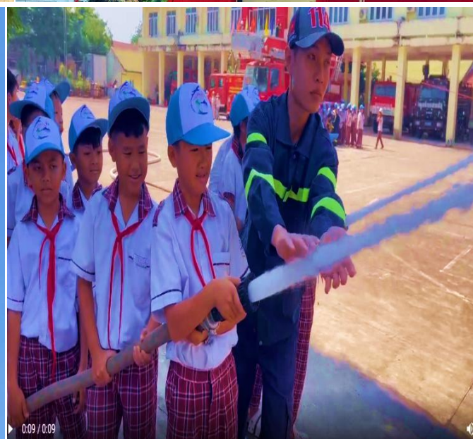
Hình ảnh học sinh tham gia thực hành phòng cháy chữa cháy, cứu nạn, cứu hộ.