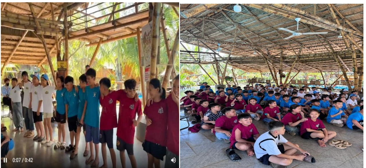
Hình ảnh học sinh học tham gia chơi các trò chơi, sôi động

Ngoài ra, các em được tham gia các hoạt động vận động, trò chơi đồng đội, giao lưu tập thể với tinh thần đoàn kết, nhiệt tình và đầy năng lượng. Những tiếng cười rộn ràng, những phút giây thi đua hào hứng đã giúp các em thêm gắn bó với bạn bè, mạnh dạn, tự tin hơn trong giao tiếp và sinh hoạt tập thể. Hoạt động này không chỉ mang lại niềm vui mà còn góp phần xây dựng tinh thần đoàn kết, tạo nên những kỷ niệm đẹp và đáng nhớ trong hành trình trải nghiệm của các em học sinh.