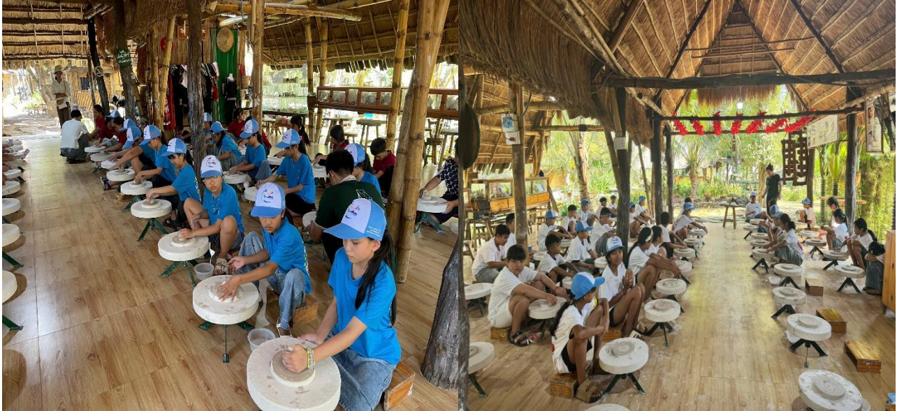
Hình ảnh học sinh trải nghiệm làm gốm tại làng PáMé

Trong khuôn khổ chương trình, học sinh còn được tham gia trải nghiệm làm gốm tại khu du lịch làng PáMé theo phương pháp truyền thống của làng nghề Bát Tràng. Hoạt động giúp các em hiểu thêm về giá trị của lao động, phát huy tính sáng tạo, đồng thời góp phần giáo dục ý thức giữ gìn và phát huy các giá trị văn hóa truyền thống.