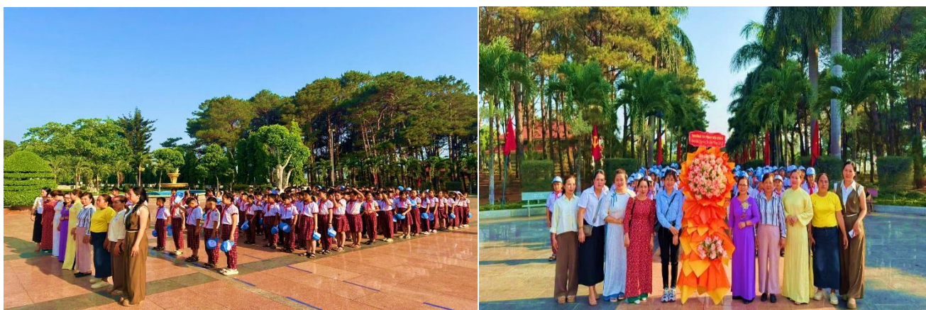
Hình ảnh giáo viên và học sinh trang nghiêm dâng hương tại nghĩa trang liệt sĩ

Trong hành trình, điểm đến đầu tiên là nghĩa trang liệt sĩ. Tại đây, các em học sinh đã tham gia lễ dâng hương, tưởng niệm các anh hùng liệt sĩ trong không khí trang nghiêm, thành kính. Hoạt động có ý nghĩa giáo dục sâu sắc, góp phần bồi dưỡng truyền thống “uống nước nhớ nguồn”, nâng cao nhận thức và lòng biết ơn đối với các thế hệ đi trước đã hy sinh vì độc lập, tự do của dân tộc.