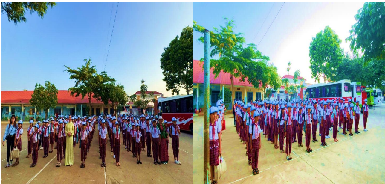
Hình ảnh học sinh tập trung tại sân trường trước giờ xuất phát

Chương trình được tổ chức chu đáo, đảm bảo an toàn, với sự tham gia đầy đủ của cán bộ, giáo viên và học sinh. Ngay từ đầu buổi sáng, các em học sinh đã có mặt đầy đủ, thể hiện tinh thần nghiêm túc, háo hức và sẵn sàng tham gia các hoạt động trải nghiệm.